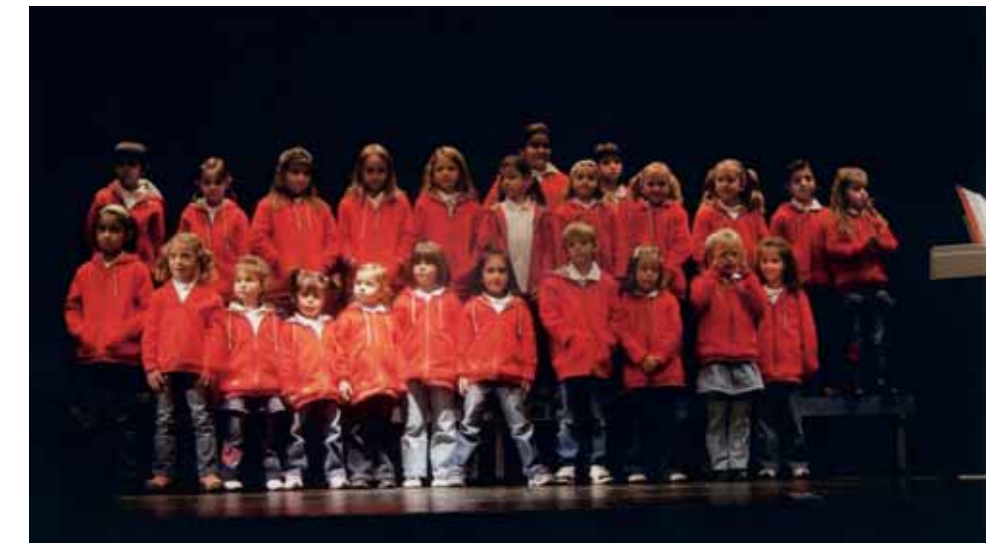
«Le cicale del Vedeggio» il coro di voci bianche fondato nel 2007.

In questo poco tempo i bambini si sono esibiti in numerosi concerti, più volte alla sala Aragonite di Manno con dei cori ospiti, al Kurhaus di Cademario, al teatro di Banco, alla chiesa di Pura con canti natalizi, al Centro Evangelico di Magliaso, alla sala Multiuso di Cadempino, a Mezzovico alla sala comunale “La Quercia”, all’albergo Cacciatori di Cademario, in diverse case per anziani della zona e sono stati recentemente ospiti al concerto dei “Canterin da Cadempin”.